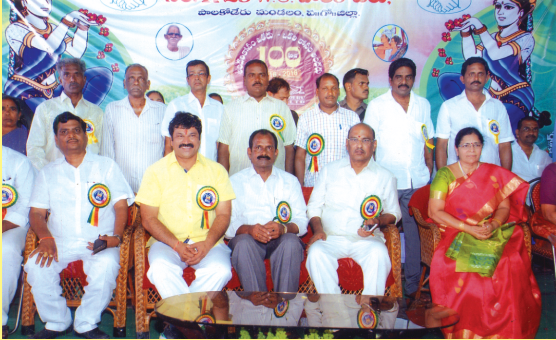
పశ్చిమ గోదావరి జిల్లా, పాలకోడేరు విశాల సహకార పరపతి సంఘ శత వసంతాల కార్యక్రమాంలో పాల్గొన్న అతిథులు