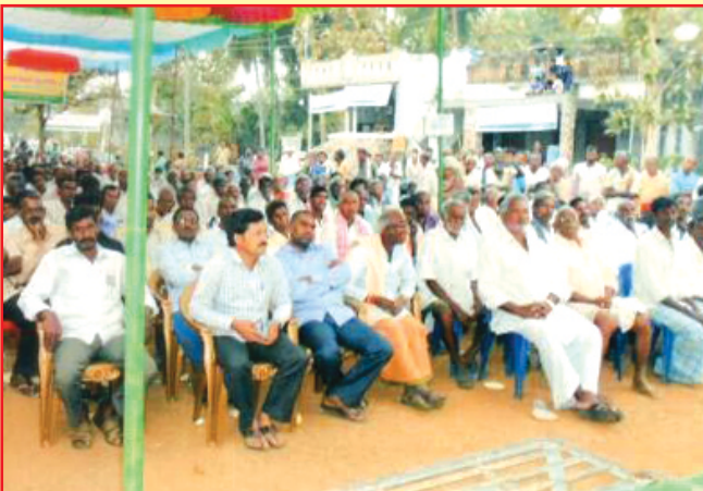
విజయనగరం జిల్లా గార్ల మండలంలోని తెట్టంగి పిపిసిఎస్ నందు డివిడెండు పంపిణీ కార్యక్రమమునకు హాజరైన సభ్యులు